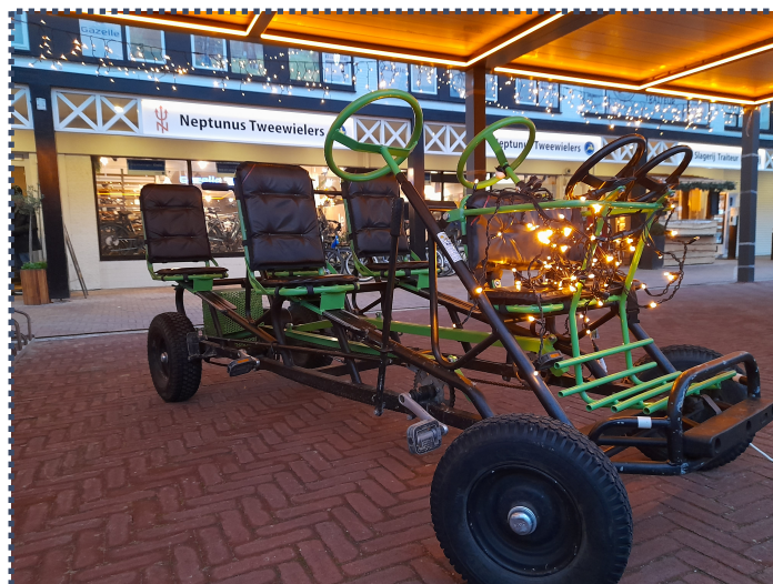
Foto: Vierpersoonsfiets van Neptunus Tweewielers